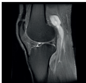
Figura 1 RM com identificação da AVP esquerda.

Foi encaminhado para Cirurgia Vascular, tendo realizado eco Doppler e flebografia ascendente (figura 2), que confirmaram o achado prévio. Iniciou hipocoagulação e foi proposto para correção cirúrgica do aneurisma.