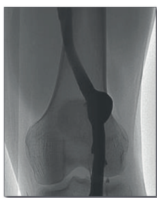
Figura 2 Flebografia ascendente do membro inferior esquerdo.

Foi submetido a cirurgia, por abordagem posterior, com isolamento da veia poplítea e controlo distal e proximal ao aneurisma, tendo-se procedido a aneurismectomia tangencial com venorrafia lateral (figura 3). Durante a cirurgia foi possível visualizar que o aneurisma se encontrava em contacto com o nervo ciático (figura 4).