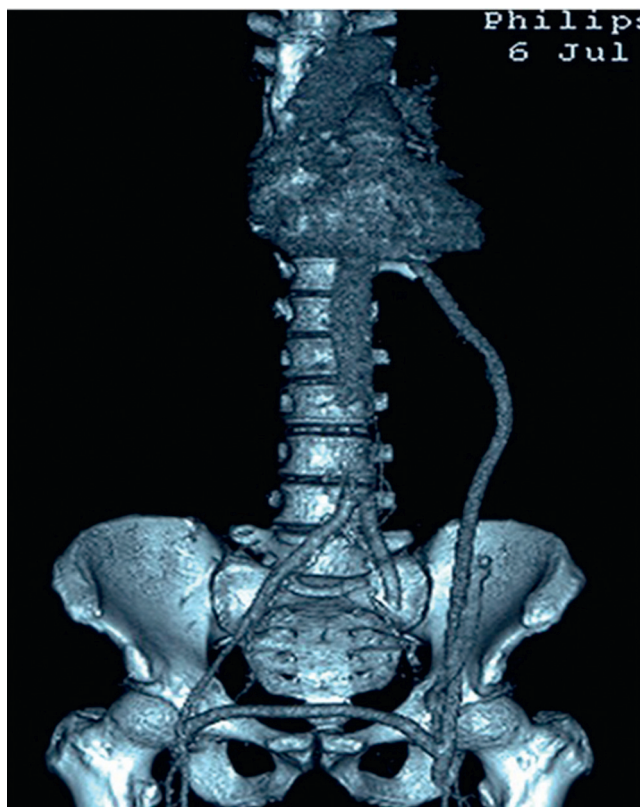
Figura 2 Caso clínico 3. Doente de 57 anos, «sem-abrigo», com antecedentes pessoais de oclusão de bypass aorto-bifemoral e de bypass axilo-bifemoral, ambos sujeitos a múltiplas revisões cirúrgicas. Apresentava isquemia grau III dos membros inferiores. Submetido a bypass da aorta torácica descendente – femoral esquerda – e a bypass protésico – femoral direita. A angio-TC de controlo documenta a permeabilidade do enxerto um ano após o procedimento. O doente posteriormente deixou de comparecer nas consultas de seguimento.

de modo global o risco cirúrgico. O work-up consistiu em análises sanguíneas (hemograma com contagem de plaquetas, estudo da coagulação, creatinina, ureia, ionograma, glucose e transaminases hepáticas, bem como gasimetria arterial), eletrocardiograma (ECG), radiografia de tórax, ecocardiograma transtorácico e estudo da mecânica ventilatória. Nenhum dos doentes apresentava alterações analíticas de relevo. Os 2 doentes que apresentavam hipertensão arterial não controlada e manifestavam no ecocardiograma hipertrofia ventricular esquerda ligeira foram referenciados previamente à intervenção à cardiologia e otimizada a sua terapêutica anti-hipertensiva. Dois dos doentes que apresentavam critérios de diagnóstico de DPOC, classificação GOLD 1, foram submetidos a cinesioterapia respiratória nos 3 dias prévios à cirurgia e otimizada a terapêutica inalatória com o apoio da pneumologia.