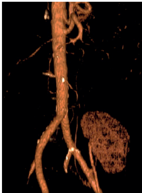
Figura 3 "Angiotomografia computadorizada (angio-TC) após a correção cirúrgica do kinking da artéria renal com uma pontagem entre a artéria ilíaca externa esquerda e a artéria renal do enxerto com veia grande safena.

As complicações vasculares correspondem a apenas 5 a 10% de todas as complicações pós-transplante renal, porém são uma causa frequente de perda do enxerto (6) . O kinking da artéria renal no transplante é uma complicação rara que pode comprometer a viabilidade