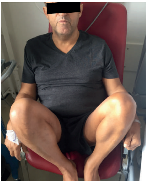
Figura 2 "posição de côcaras" necessária para que o doente manter a diurese.

No entanto, após três meses o doente iniciou uma redução gradual da diurese e agravamento da função renal com necessidade de permanecer em “posição de côcaras” 5 horas por dia para manter o débito urinário adequado (FIG. 2). Essa situação levou a uma redução acentuada na qualidade de vida do doente. Foi proposto tratamento cirúrgico e explicado ao doente a possibilidade de perda do enxerto. O doente optou pela cirurgia corretiva e foi submetido a uma pontagem entre a artéria ilíaca externa esquerda e a artéria renal do enxerto com veia grande safena autóloga (FIG. 3). No pós-operatório, o doente recuperou totalmente a diurese e a função renal. Aos dois anos de seguimento permanece com enxerto funcionando sem agravamento da função renal.