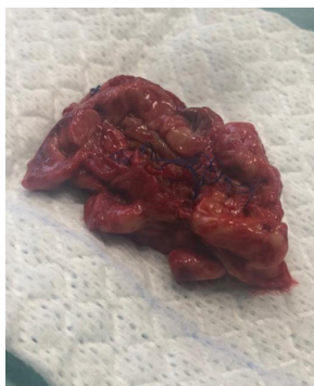
Figura 3 Patch de pericárdio bovino infectado

Procedeu-se a desbridamento extenso de todo o tecido infectado e à excisão do patch , lavagem da loca e preenchimento da mesma com retalho vascularizado de epíplon . A microbiologia do patch identificou Candida glabrata e no líquido pericoto aórtico foi identificado, para além do acima referido, Enterococcus faecium . Foi realizada terapêutica com linezolid, metronidazol e anidulofungina, sendo que teve alta após boa evolução clínica e laboratorial, sob AB dirigida. O doente mantém-se clinicamente assintomático aos 5 meses de follow-up .