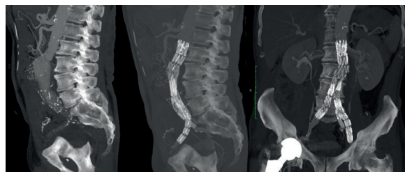
Figura 1 Angio-CT pré- e pós-operatória de aneurisma aorto-ilíaco esquerdo excluído eletivamente com endoprótese bifurcada Zenith flex (Cook®) e IBD (Cook®) esquerda associada a stent Atrium Advanta V12 (Maquet®)

aneurismático da artéria ilíaca comum bilateralmente; em dois procedeu-se à embolização da artéria hipogástrica contralateral e nos restantes IBD/IBE bilateral.