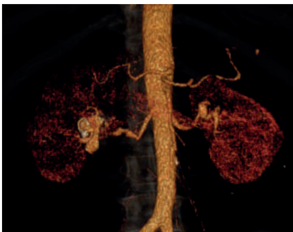
Fig 1 Angio-TC.