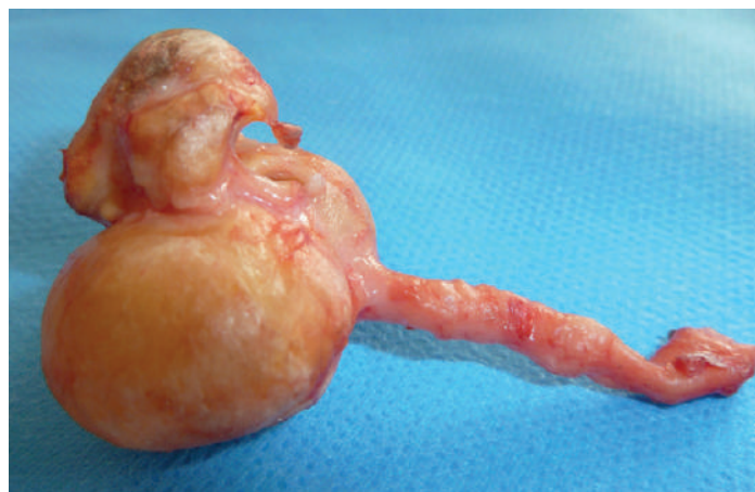
Fig 5 Aneurisma da artéria renal direita.